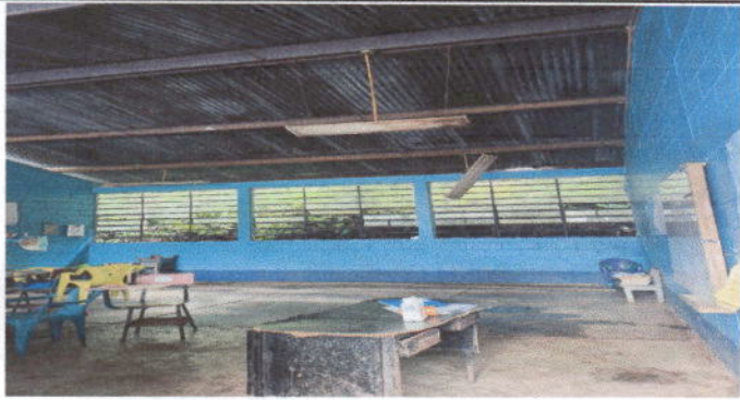
Foto1: Sustitución de lamina por lamina troquelada. Modulo 1