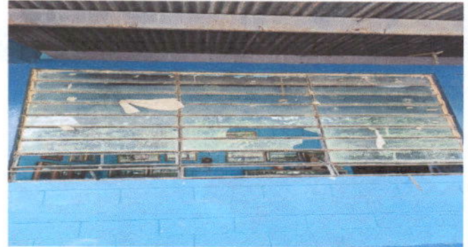
Foto 4: Fabricación e instalación de balcones de hierro en ventana